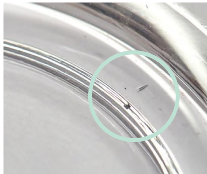
微細なきずや擦れ

製造工程中に空気がガラスに入り込むことで生じる、小さな気泡や点、または気泡の痕跡です。