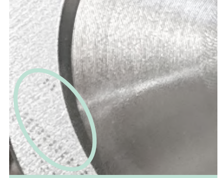
加工の圧力によるプレス痕