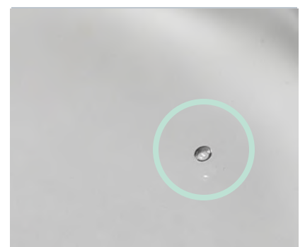
気泡および気泡の裂け跡

製造工程中に空気がガラスに入り込むことで生じる、小さな気泡や点、または気泡の痕跡です。