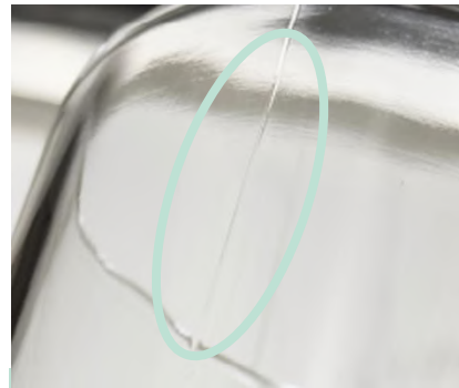
金型の痕跡・継ぎ目

わかりやすくお伝えするために拡大しておりますが、味わいとして楽しめる微細な痕跡となります。外観の美しさを損なう大きな痕跡の製品は工場検品時に除外しております。