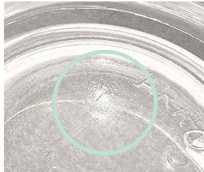
底面の気泡痕テクスチャー

高温で手作業により製造される製品の特性上、底面に微細な気泡の紋様が現れる場合がございます。