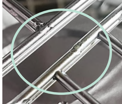
ごく僅かな色の違い

溶接部分は電解研磨工程を経ており、過程で部位によって微細な色の違いが生じる場合がございます。