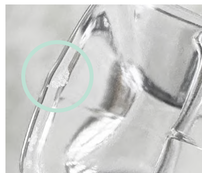
熔融ガラスの冷却痕

高温で手作業により製造される製品の特性上、底面に微細な気泡の紋様が現れる場合がございます。